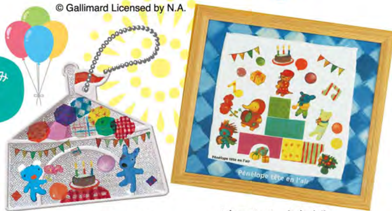
ベネロベ キラキラリフレクター