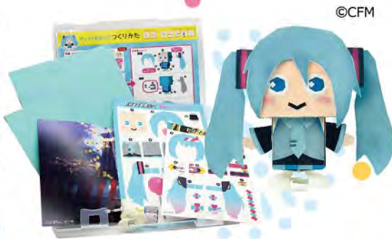
ゼンマイ初音ミク

人気キャラは問答無用で強い。好きなキャラがいるだけで人を集める力がある。しかも、キャラ目当てで来ている子供もやがて、作ること自体の魅力に気づく。作り終わったころには立派な工作ファンのできあがり。