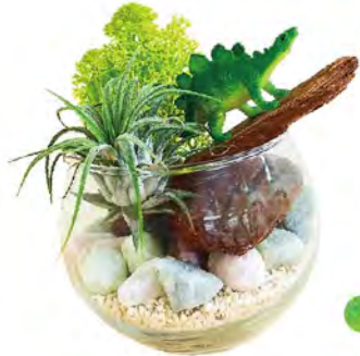
グラスガーデン 恐竜.ver