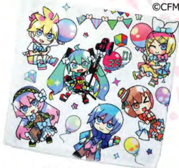
初音ミクアートタオル

キャラクターライセンスを活用！人気キャラを使った工作イベントやワークショップを開催。特別感が魅力となって、多くのファンを集客できること受け合い。